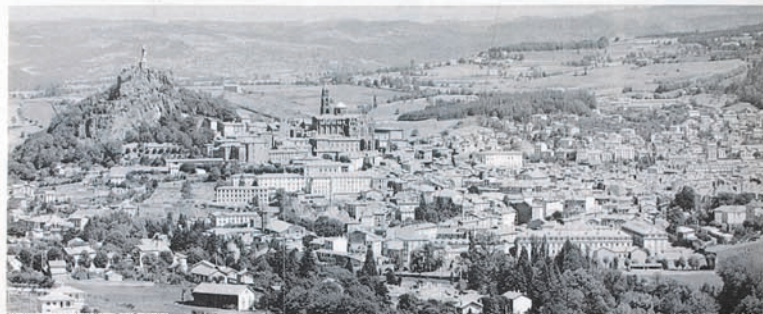
Veduta aerea di Le Puy-En-Velay

Brugherio e Le Puy en Velay nell'Alvernia (Alta Loira), si stanno finalmente per gemellare.