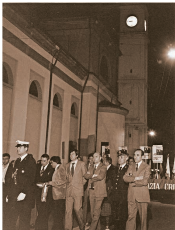
maggio 1978 Commemorazione assassinio Onorevole Aldo Moro