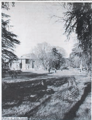
Piazza di Villa Fossola in Brugherio