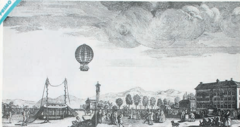
L'ascensione di Paolo Andreani e Monucco. 13 marzo 1784