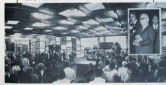
L'attuale Presidente della Repubblica ha visitato lo stabilimento della Società SAGDOS nel vasto interesse per l'economia locale di Brugherio.