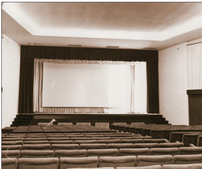
19 novembre 1974 Inaugurazione Auditorium Civico in Via San Giovanni Bosco