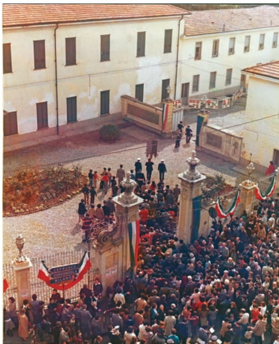
8 maggio 1977 Inaugurazione Parco di Villa Fiorita Il futuro municipio, prima dei restauri, apre il parco alla cittadinanza.