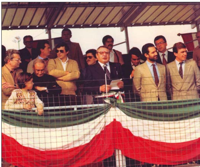
11 ottobre 1981 Inaugurazione nuovo Centro Sportivo Comunale di via San Giovanni Bosco.