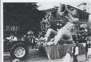
Il carro vincitore del Palio '96

Ha vinto Increa! Il carro allegorico intitolato: "Ani Suona il mondo", ideato dall'artista brugherese Armando Fattolin e risultato il più votato e apprezzato dalla giuria incaricata di assegnare il Palio carnevalesco 1996. Il carro vincitore rappresenta un direttore d'orchestra sùprio che scuote la testa per l'aspirazione del suonatore di trombone -che rappresenta il mondo intero alla prese con la musica- seduto sopra di lui. Il carro è stato seguito da un corteo di uomini e donne mascherati da ballerini spagnoli e brasiliani.