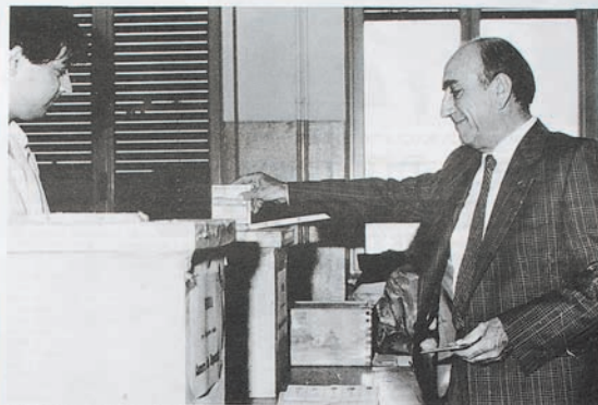
Il Sindaco, Edoardo Tenuzzi, al momento del voto

Abbiamo infine utilizzato il materiale già disponibile al momento di andare in macchina: fra l'altro, una intervista all'Assessore ai lavori pubblici sulle iniziative della Giunta riguardanti la Cappella di Monuzzo. Poiché questo è l'ultimo numero prima delle ferie estive, il "NOTIZIARIO COMUNALE" augura a tutti i brugheriesi una piacevole estate e buone vacanze.