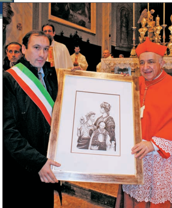
gennaio 2010 Celebrazioni Epifania: il Sindaco Ronchi dona al Cardinale Tettamanzi una litografia a nome della cittadinanza.