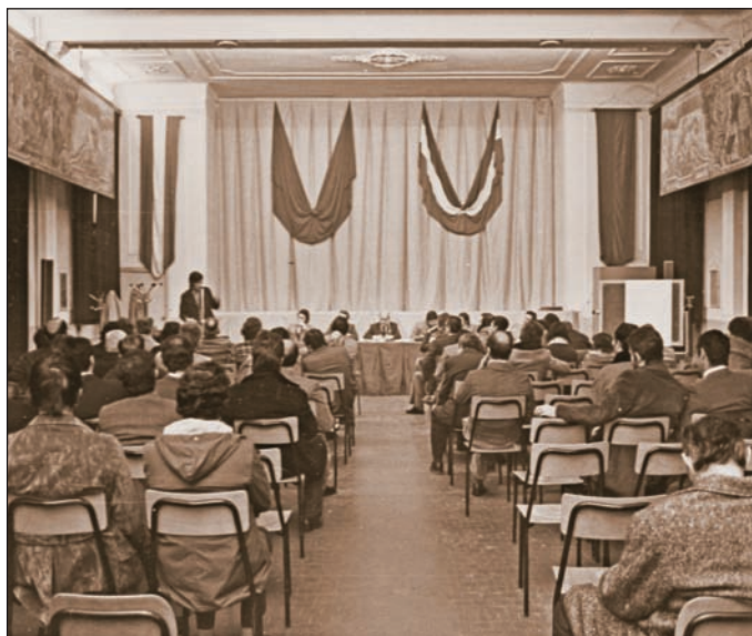
maggio 1973 La sede dell'Aula Consiliare dal 1973 al 1980 in Via Vittorio Veneto, presso la Scuola Sciviero