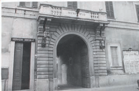
Villa Ghirlanda ieri e oggi