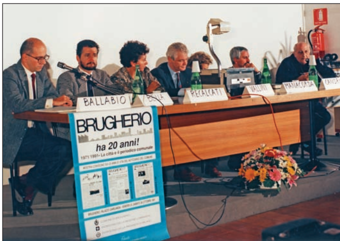
25 ottobre 1991 Mostra Convegno sui 20 anni del Notiziario Comunale