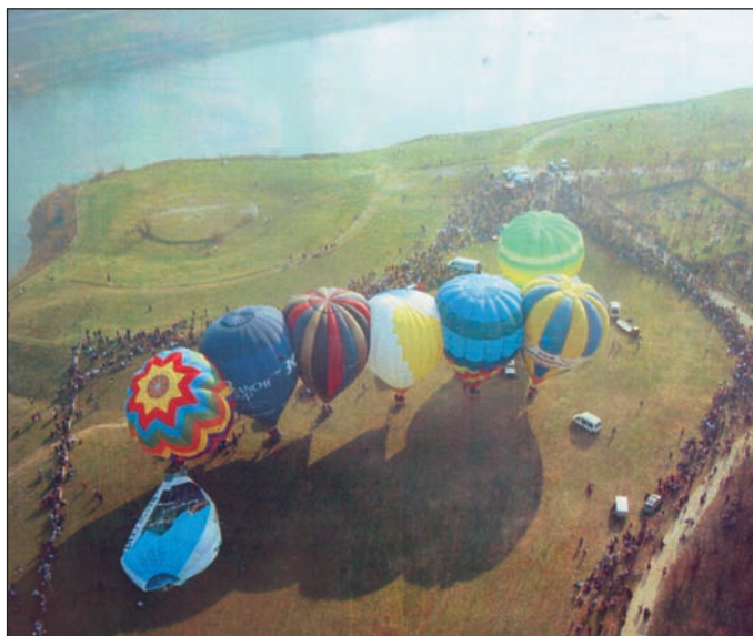
15 marzo 2009 Celebrazioni 225° anniversario primo volo aerostatico in Italia Raduno internazionale di mongolfiere a Parco Increa