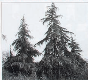
Uno scorcio del Parco Comunale Cava Increa

Il prossimo 15 maggio verrà aperto al pubblico il Parco Comunale Cava Increa, dopo una breve cerimonia d'inaugurazione. Si tratta di un'area a verde di ben 65.000 mq., la parte oggi disponibile dell'intero parco comunale, che comprenderà, una volta terminato, anche una zona a lago, un solarium e vari servizi (bar, ristorante, teatro all'aperto, ecc.); esso risulta dal recupero ambientale della Cava Increa, attiva sul nostro territorio già da molti anni. Un'altra area sarà aperta al pubblico nel giugno 1995, mentre l'ultimo lotto comprendente il lago sarà consegnato al comune nel 1997; fino ad allora il Parco continuerà con l'attività di cura e