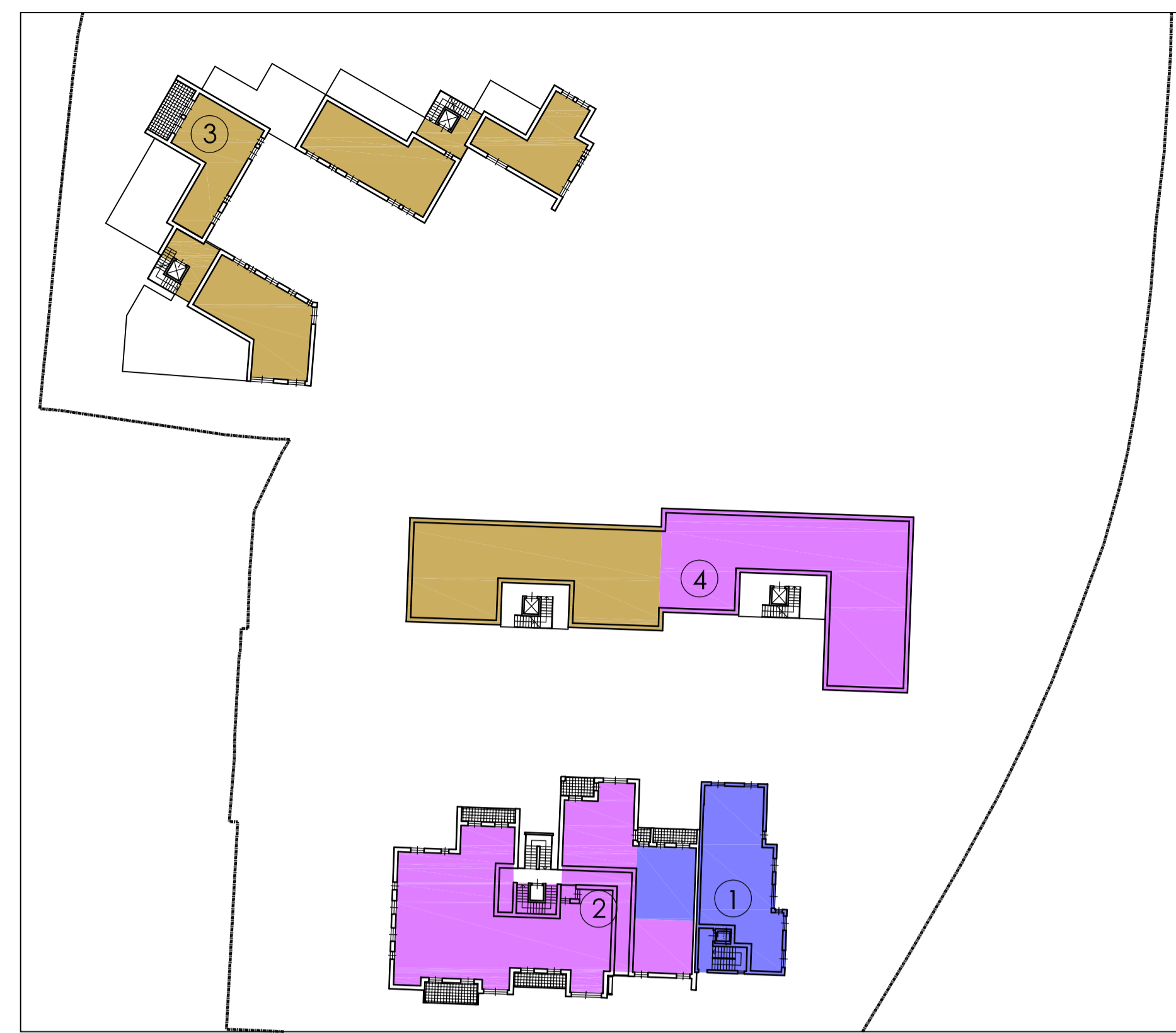
PIANO PRIMO - 1:500