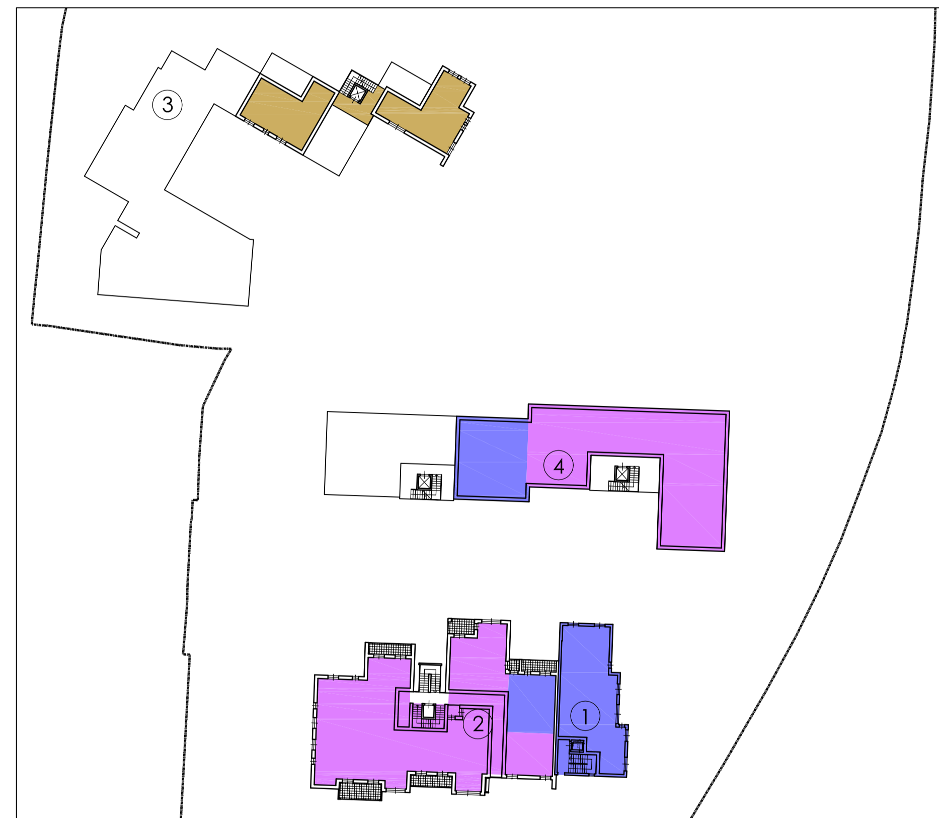
PIANO SECONDO - 1:500