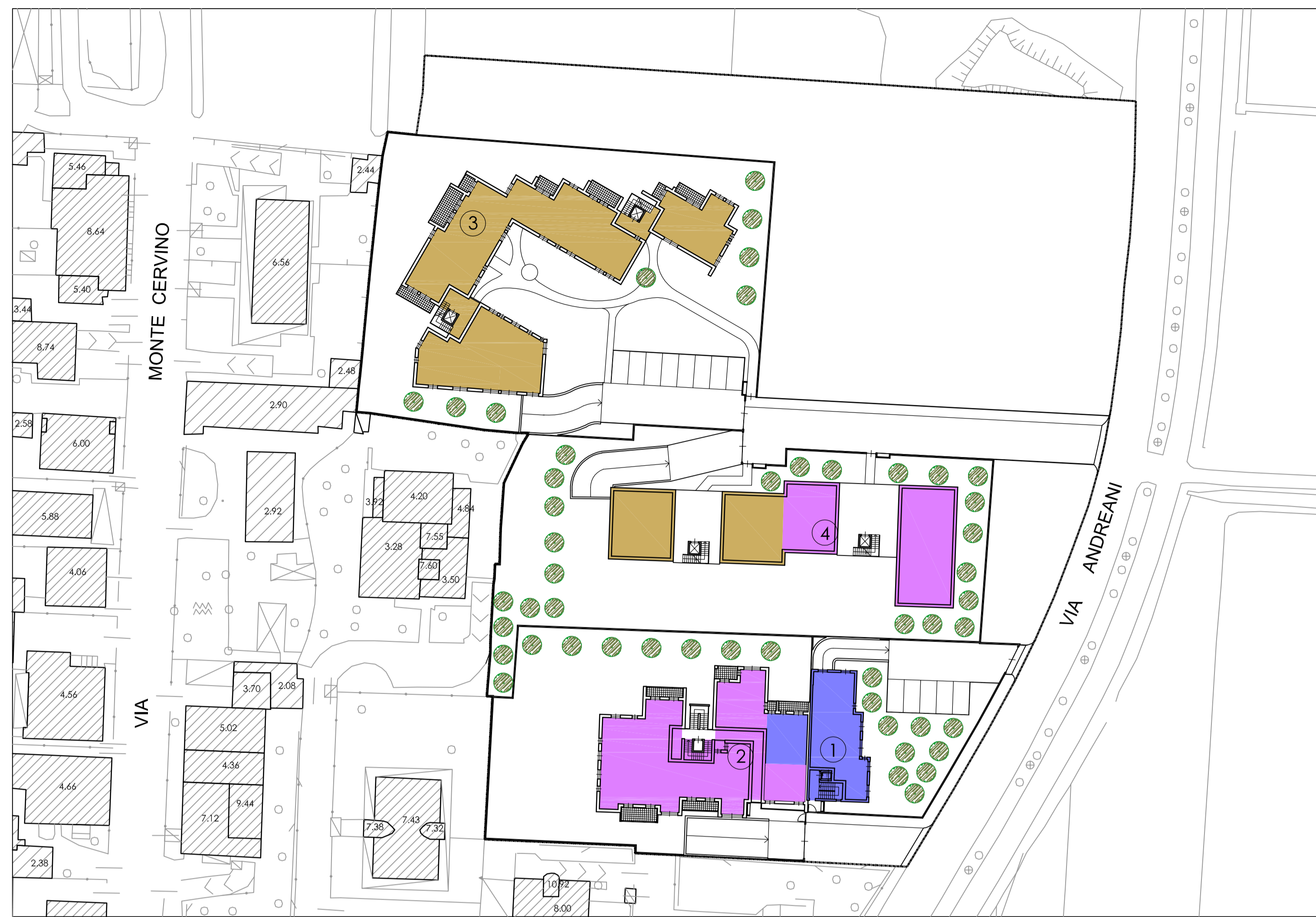
PIANO TERRA - 1:500