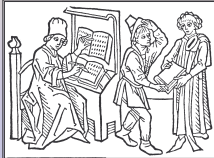
Xilografia tedesca del 1491